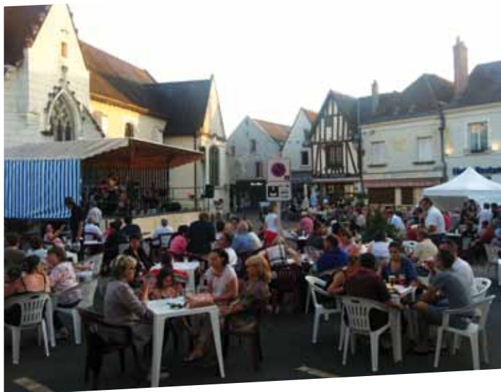
Surprise Party Jazz

Qui a dit qu'il ne se passait rien à Bléré ?