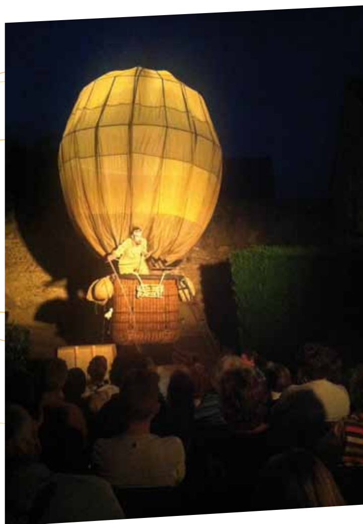
Théâtre de l'Ante